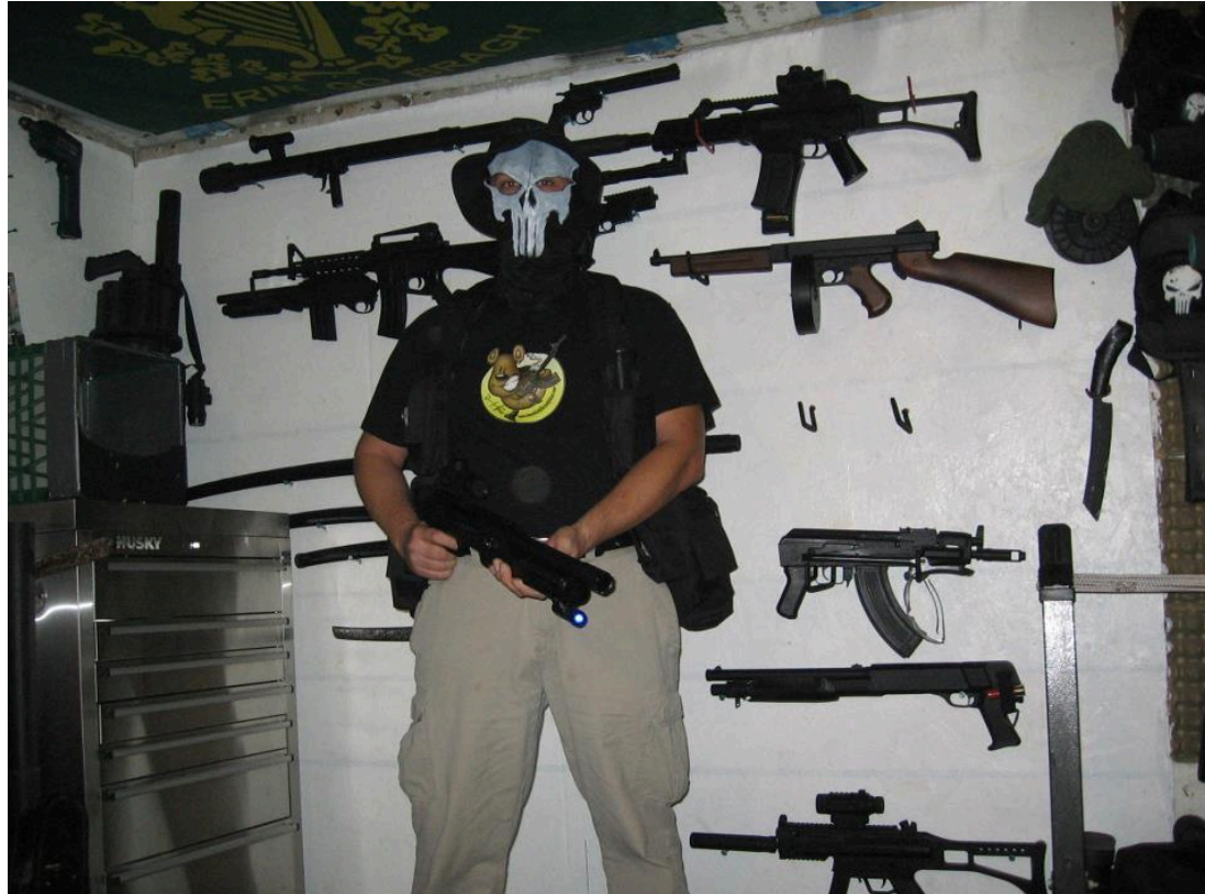
Photo découverte sur la page Facebook d'un travailleur durant l'enquête sur la menace au GC.